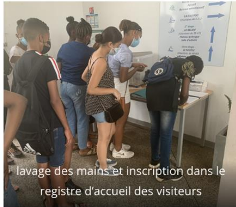
lavage des mains et inscription dans le registre d'accueil des visiteurs