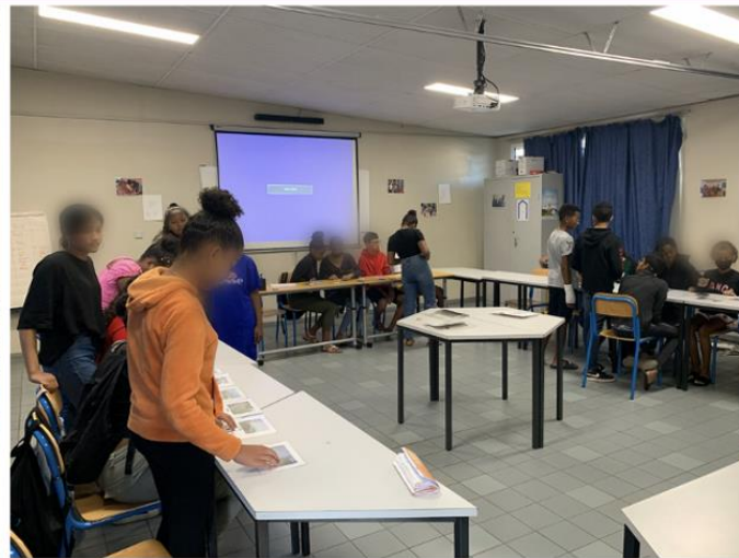
Quand la salle de projection devient une salle de jeux...