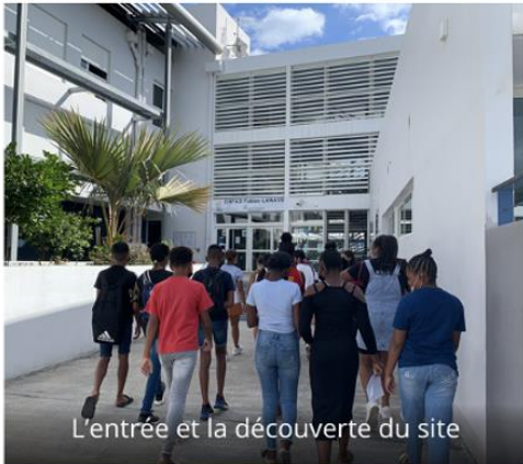
L'entrée et la découverte du site