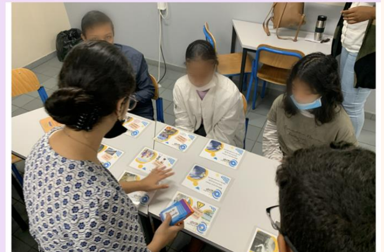
Kossa Mi Fé pendant l'alerte?...