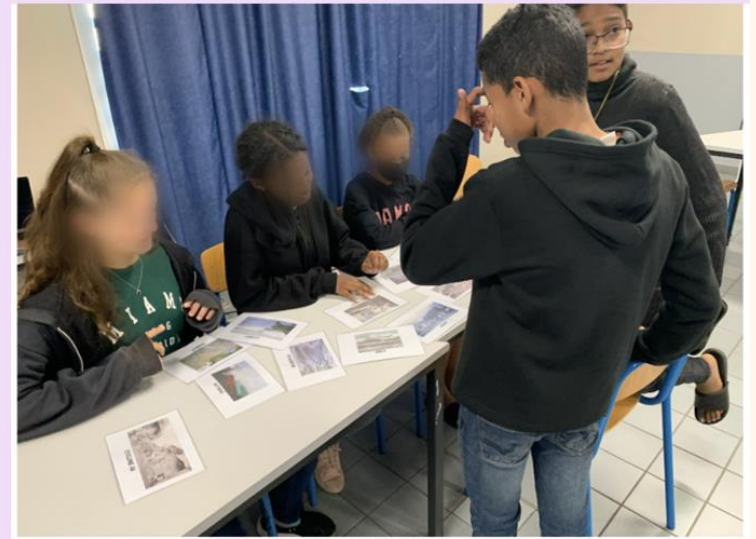
Et avant Batsiral?...